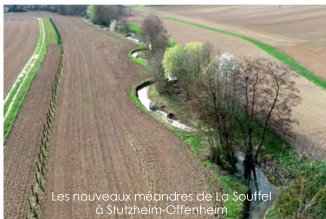
Les nouveaux méandres de La Souffel à Stutzheim-Offenheim

L'étape suivante a été la remontée du Durningebach vers la route de Schnersheim. Dans ce secteur encore prairial, est prévu, en partenariat avec le SDEA, une opération de renaturation du cours d'eau sous forme d'un reméandrage progressif.