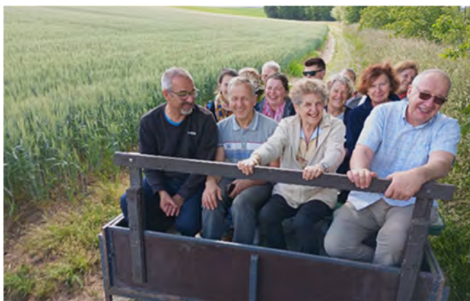
Le 25 mai, balade et repas barbecue avec la commune et le Foyer rural.