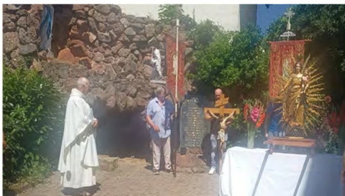
Le 14 juillet, fête du Mont Carmel.