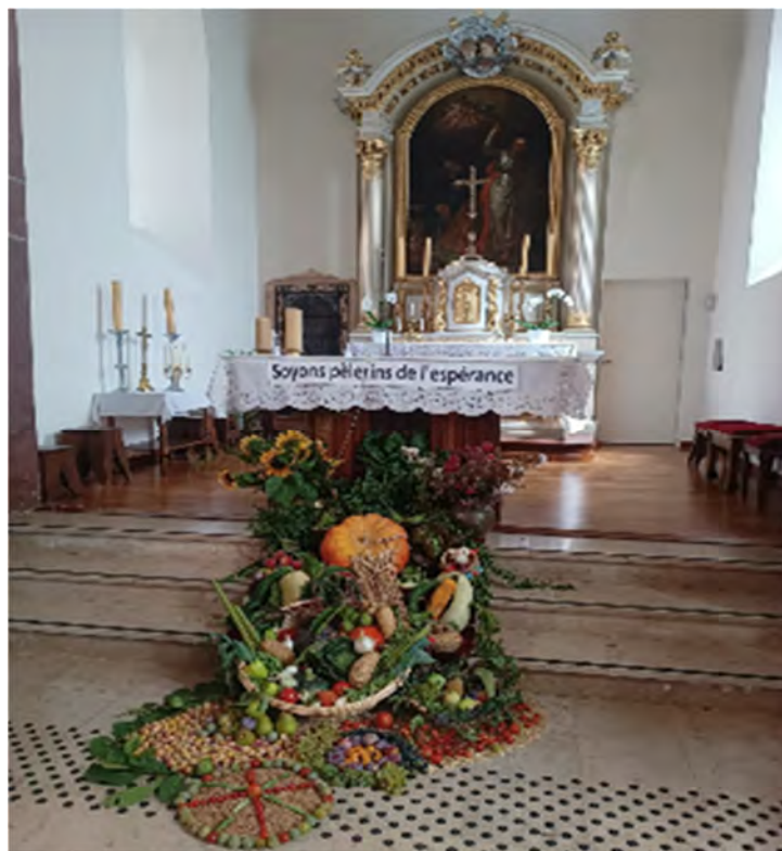
Le 15 août, fête de l'Assomption et bénédiction des récoltes.